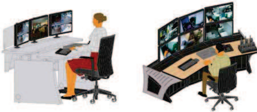
Rys. 1. Przykład stanowisk tzw. „monitorowych”

na pasku od spodni. Mimo godzinnej reanimacji, lekarz stwierdził zgon 5 .